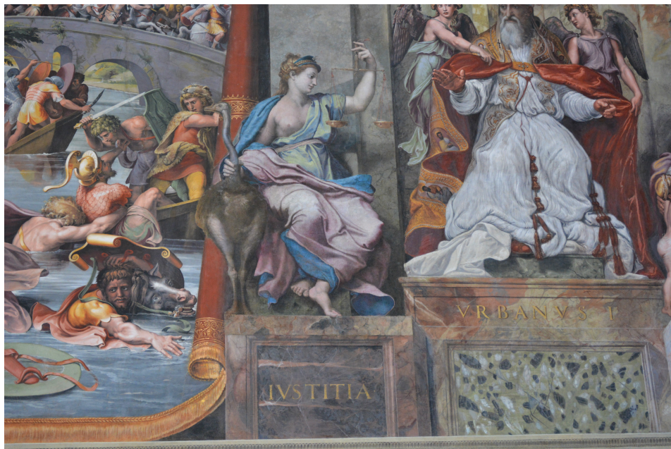
Raphaël, Allégorie de la Justice (détail de la salle de Constantin), 1519-1520, Cité du Vatican, Palazzo Apostolico

L'année 2020 marque le demi-millénaire de la mort de Raphaël. Le numéro 17 de Studiolo se joint aux célébrations par un dossier thématique dédié aux dernières recherches sur l'œuvre du peintre d'Urbino et se penche sur sa carrière, la richesse de sa production, le processus de création, ses multiples liens avec la musique et la poésie, etc., repensant ainsi les différentes facettes du mythe de Raphaël.