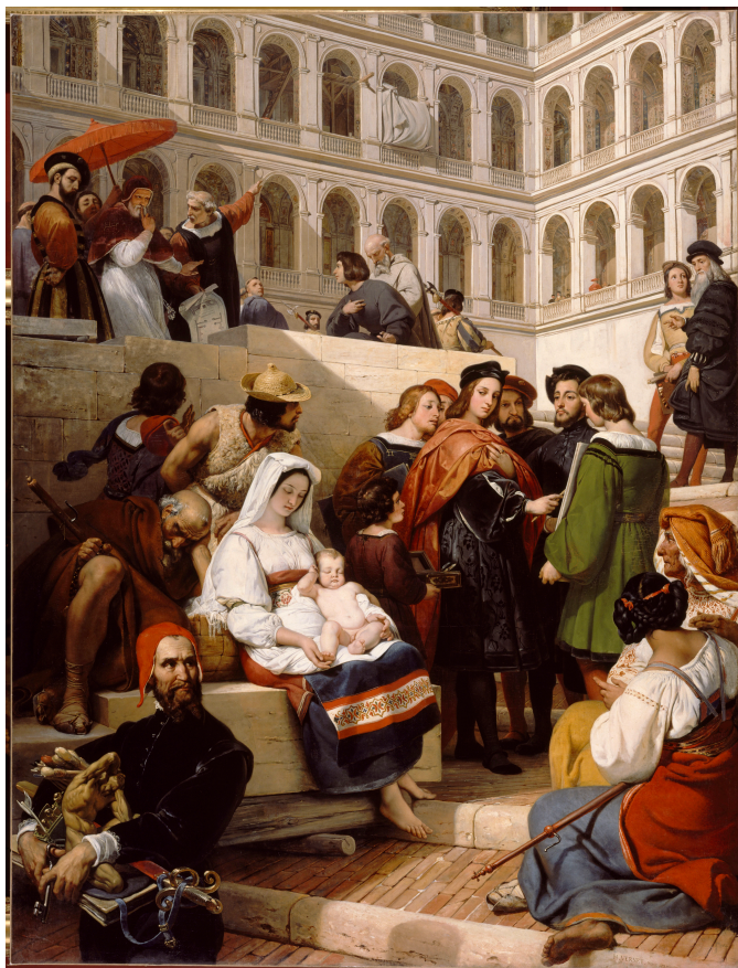
Horace Vernet, Raphaël au Vatican , Salon de 1833, Paris, musée du Louvre