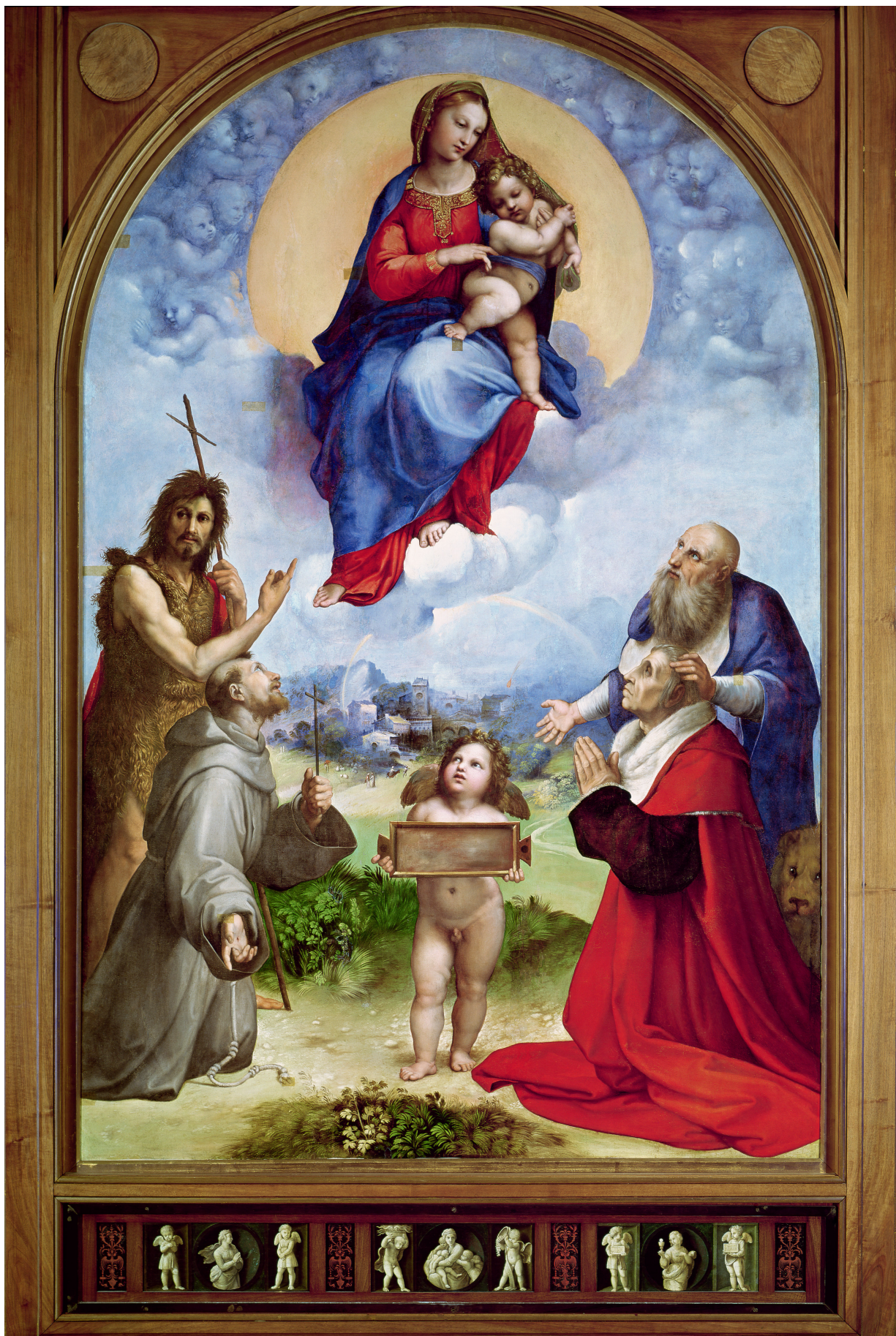
Raphaël, Vierge de Foligno , v. 1512, tempera sur bois transférée sur toile, Cité du Vatican, Pinacothèque